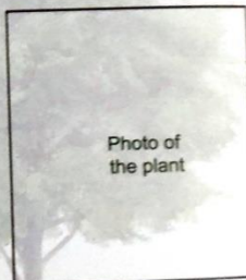
Photo of the plant